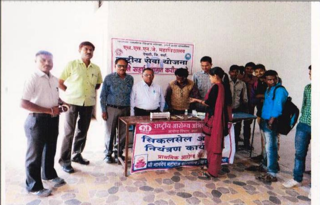
रासेयो द्वारा महाविद्यालयात आयोजित सिकलसेल तपासणी शिबीर