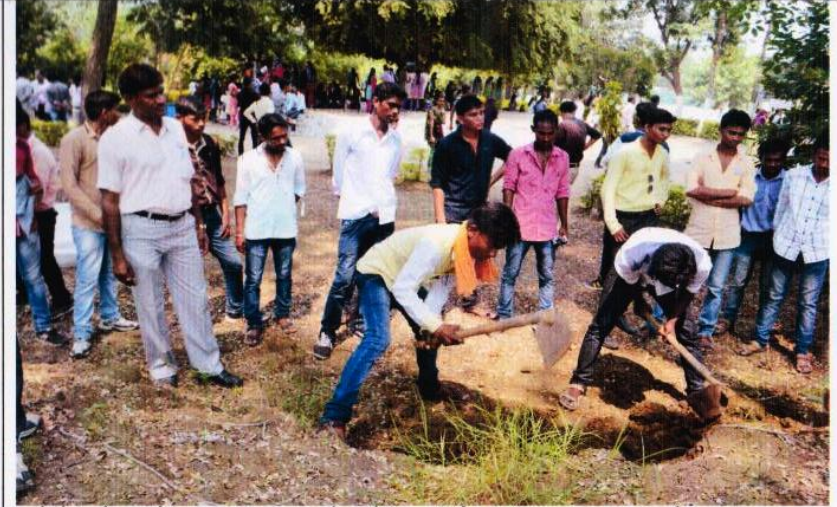
रासेयो द्वारे आयोजित आनंदवन, वरोरा येथिल विशेष सद्भावना अभ्यास दौऱ्यादरम्यान श्रमदान करतांना स्वयंसेवक