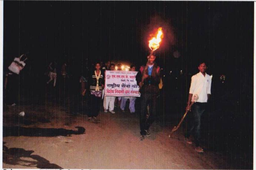
विशेष श्रम-संस्कार शिबीर, मिडी- मशाल रॅली