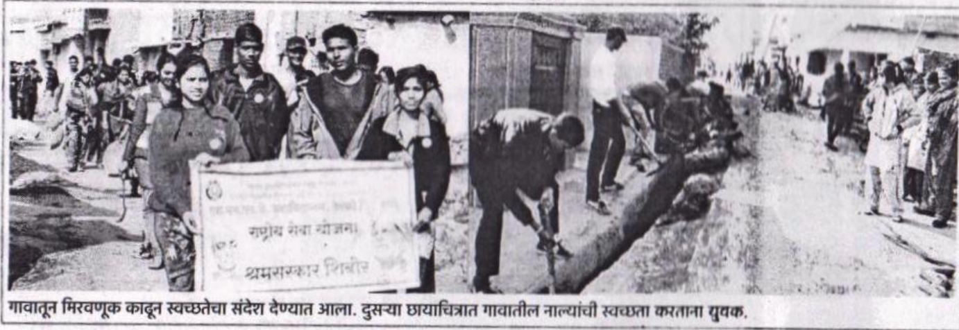
गावातून मिरवणूक काढून स्वच्छतेचा संदेश देण्यात आला. दुसऱ्या छायाचित्रात गावातील नाल्यांची स्वच्छता करताना युवक.