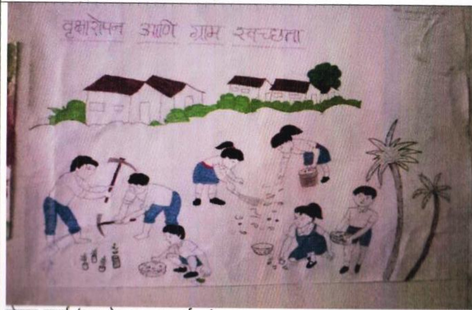
पोस्टर स्पर्धा (युवा-वैद्य सप्ताह कार्यक्रम)