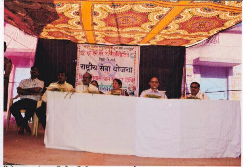
विशेष श्रम-संस्कार शिबीर, मिडी- उद्घाटन कार्यक्रम