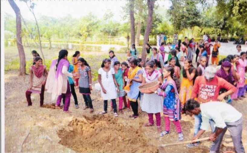
रासेयो द्वारे आयोजित आनंदवन, वरोरा येथिल विशेष सद्भावना अभ्यास दौऱ्यादरम्यान श्रमदान करतांना स्वयंसेवक