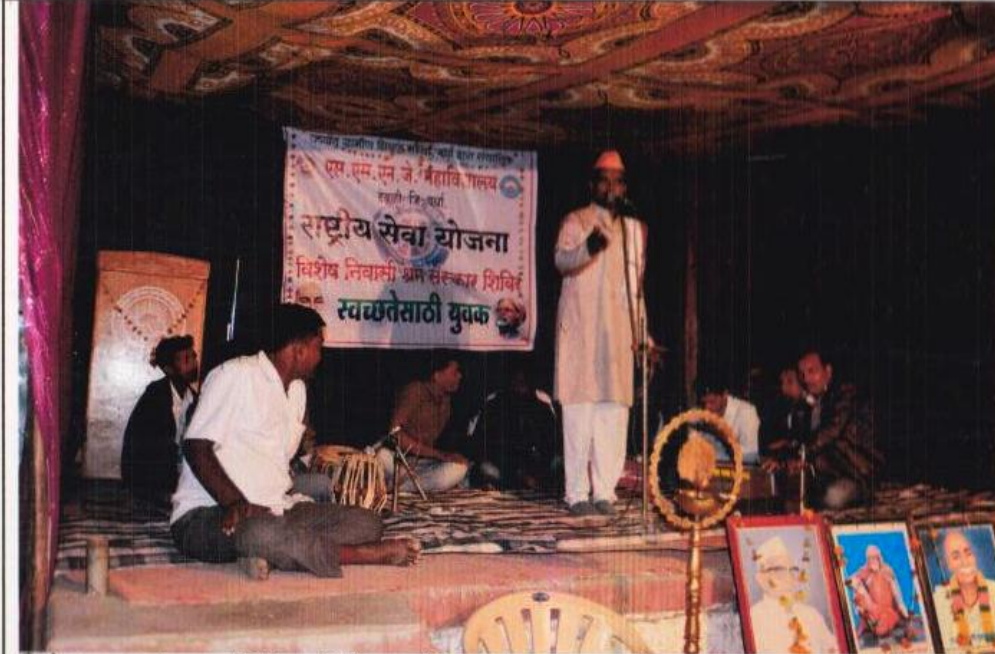
विशेष श्रम संस्कार शिबीर, मिडी- मनोरंजनातून समाजप्रबोधन