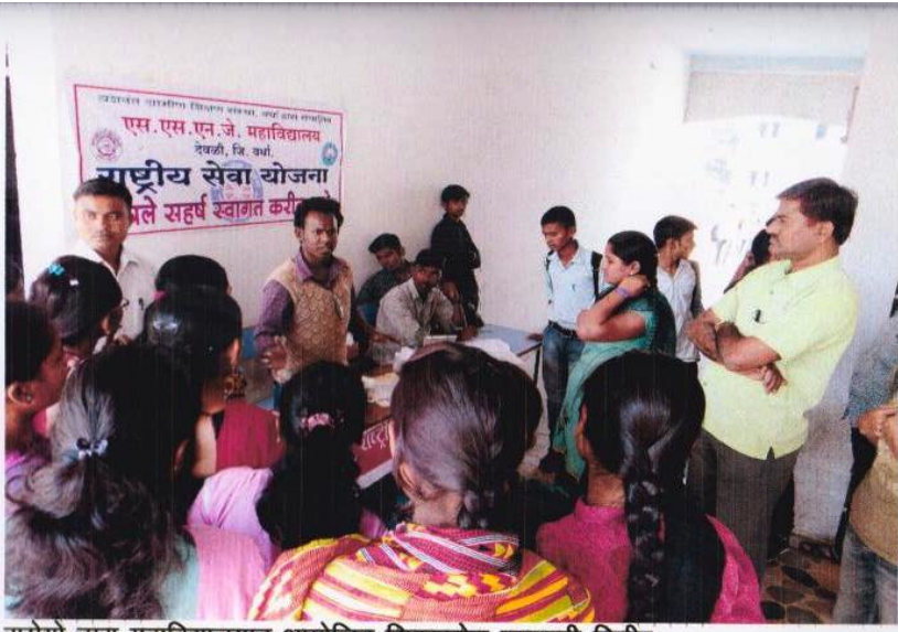
रासेयो द्वारा महाविद्यालयात आयोजित सिकलसेल तपासणी शिबीर