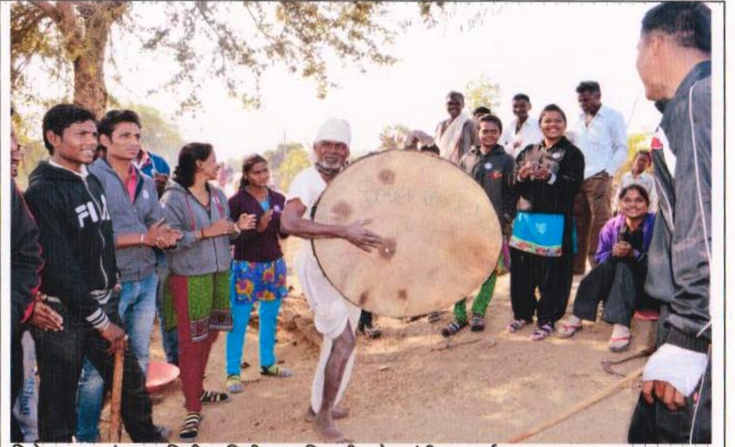
विशेष श्रम-संस्कार शिबीर, मिडी- आदिवासी लोकसंगीत प्रदर्शन