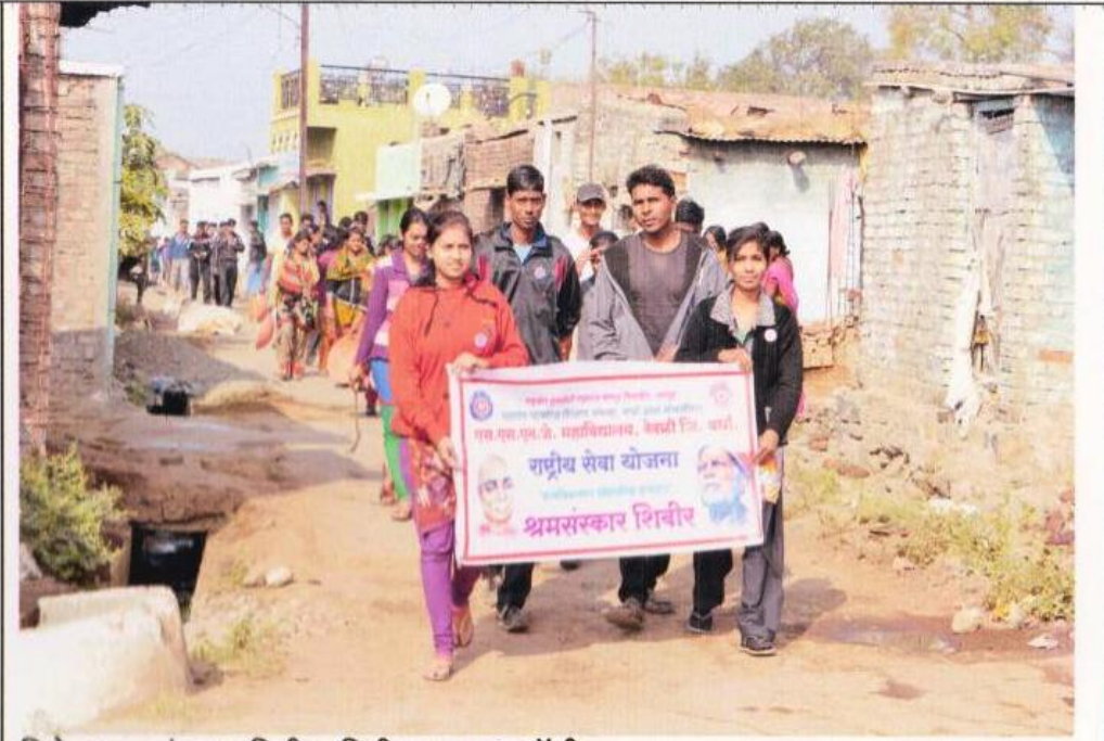
विशेष श्रम संस्कार शिबीर, मिडी- राम धुन रैली