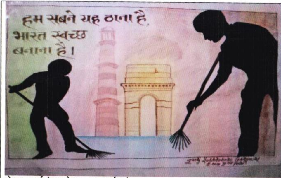
पोस्टर स्पर्धा (युवा-वैद्य सप्ताह कार्यक्रम)