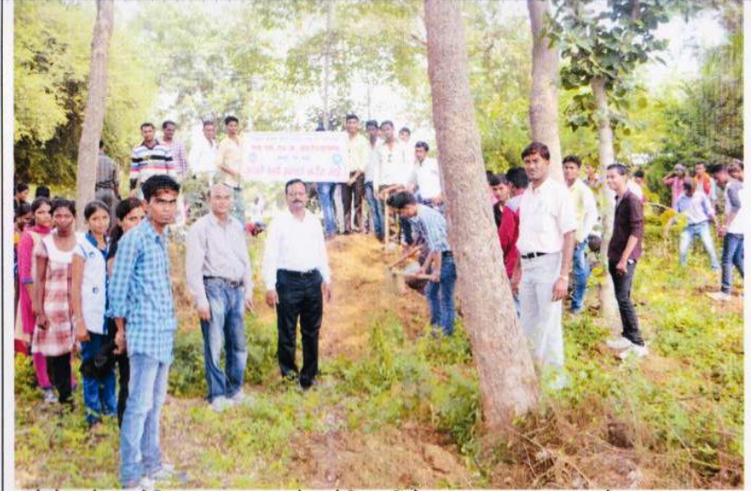
रासेयो द्वारे आयोजित आनंदवन, वरोरा येथिल विशेष सद्भावना अभ्यास दौऱ्यादरम्यान श्रमदान करतांना स्वयंसेवक