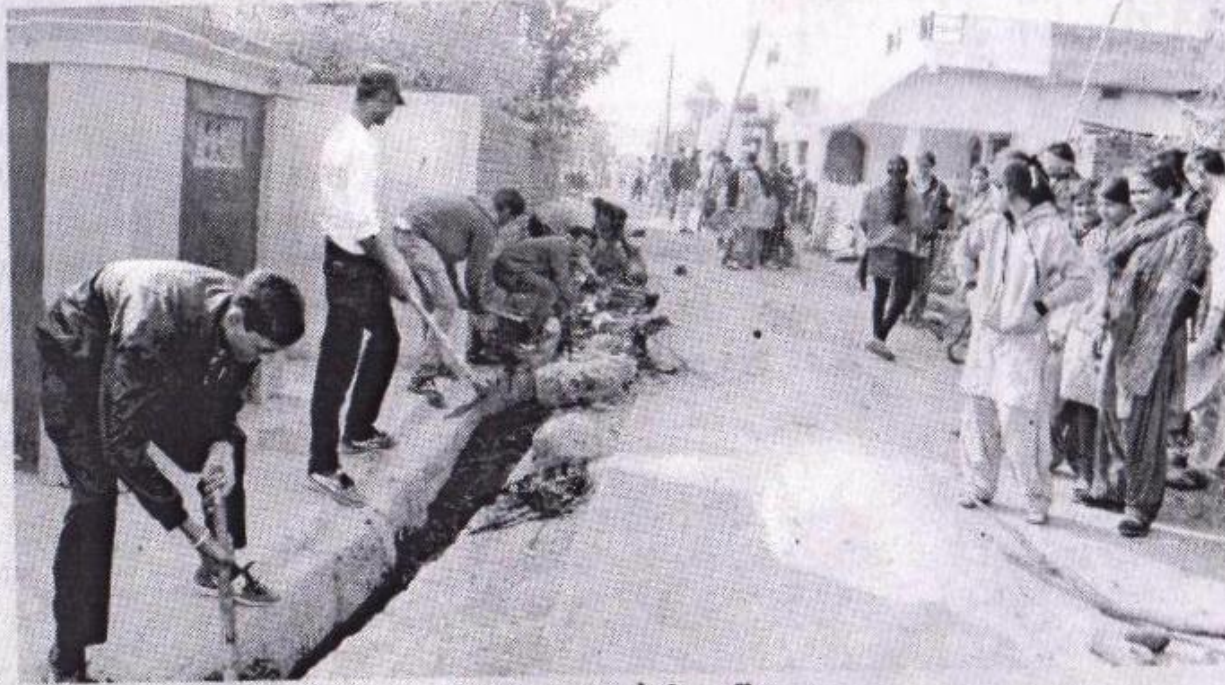
वर्धा : ग्रामस्वच्छता करताना एसएसएनजे महाविद्यालयाचे विद्यार्थी.