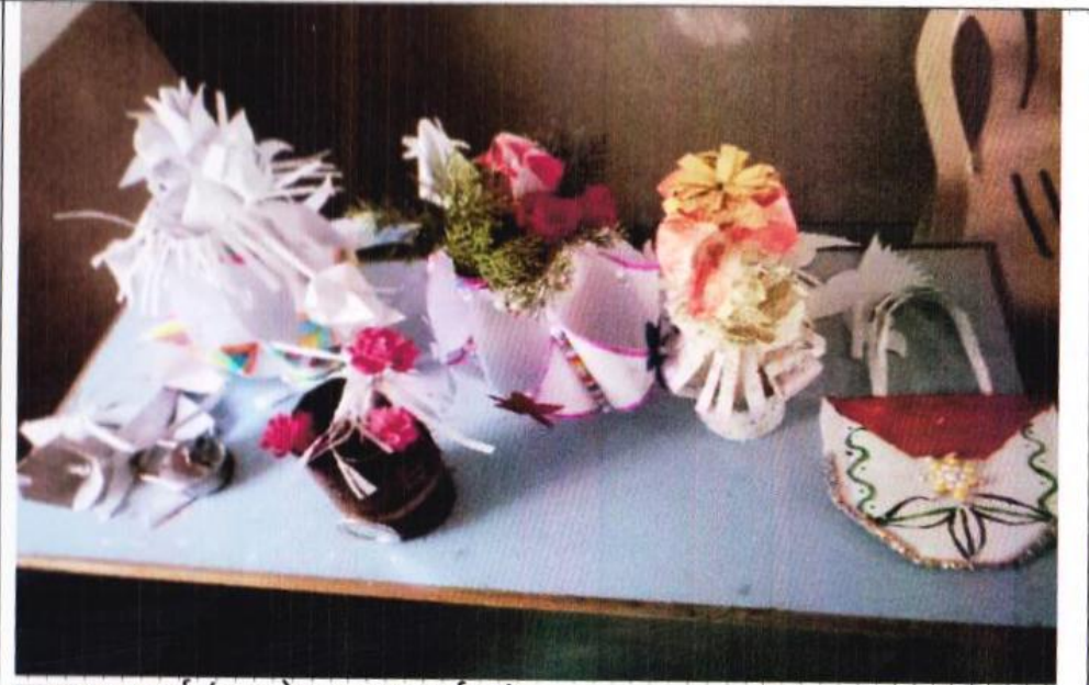
हस्तकला स्पर्धा (युवा-वैद्य सप्ताह कार्यक्रम)