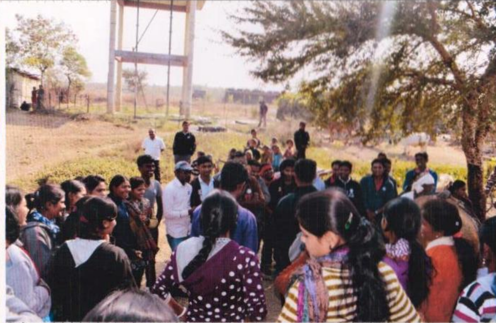
विशेष श्रम-संस्कार शिबीर, मिडी- आदिवासी बांधवांना स्वच्छते संबंधी मार्गदर्शन