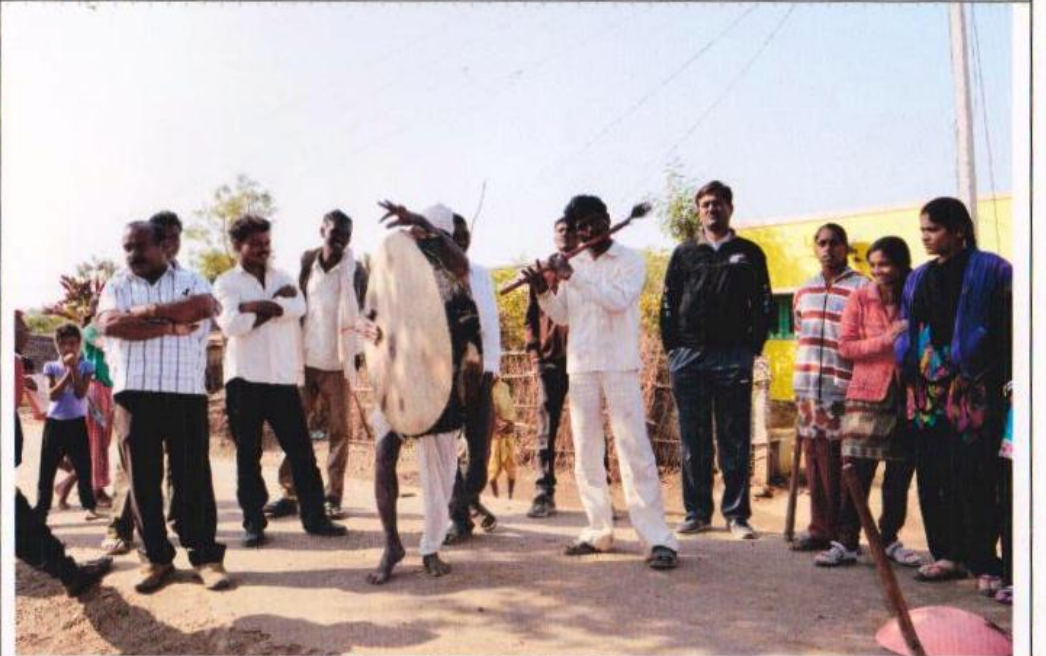
विशेष श्रम-संस्कार शिबीर, मिडी- आदिवासी लोकसंगीत प्रदर्शन