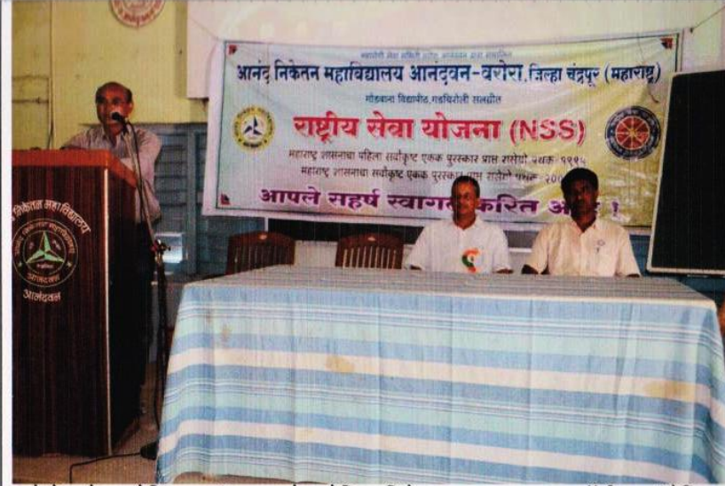
रासेयो द्वारे आयोजित आनंदवन, वरोरा येथिल विशेष सद्भावना अभ्यास रॅलीला संबोधित करतांना तेथिल कार्यक्रम अधिकारी आणि प्राचार्य