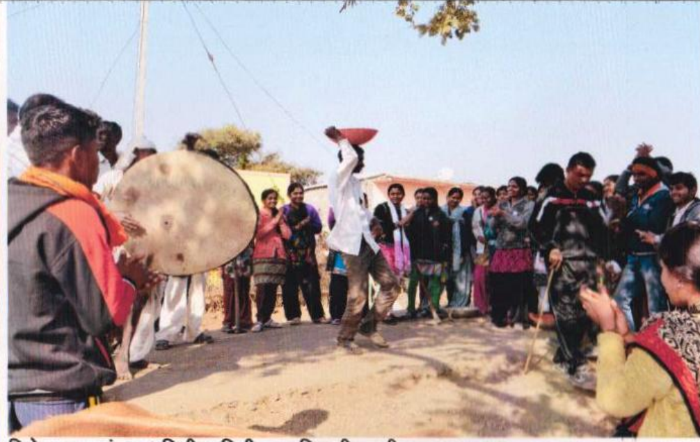
विशेष श्रम-संस्कार शिबीर, मिडी- आदिवासी वस्ती ग्राम स्वच्छता