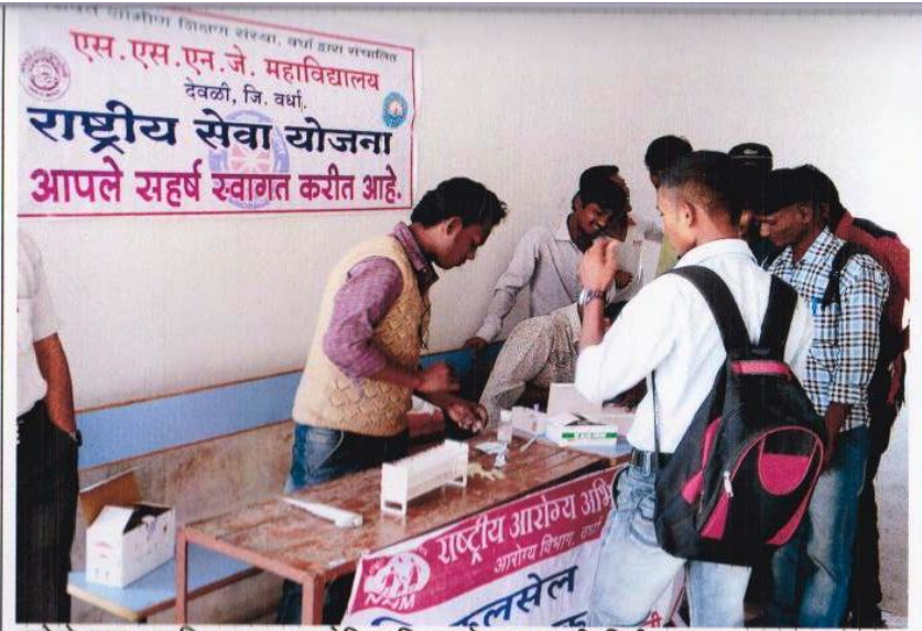
रासेयो द्वारा महाविद्यालयात आयोजित सिकलसेल तपासणी शिबीर