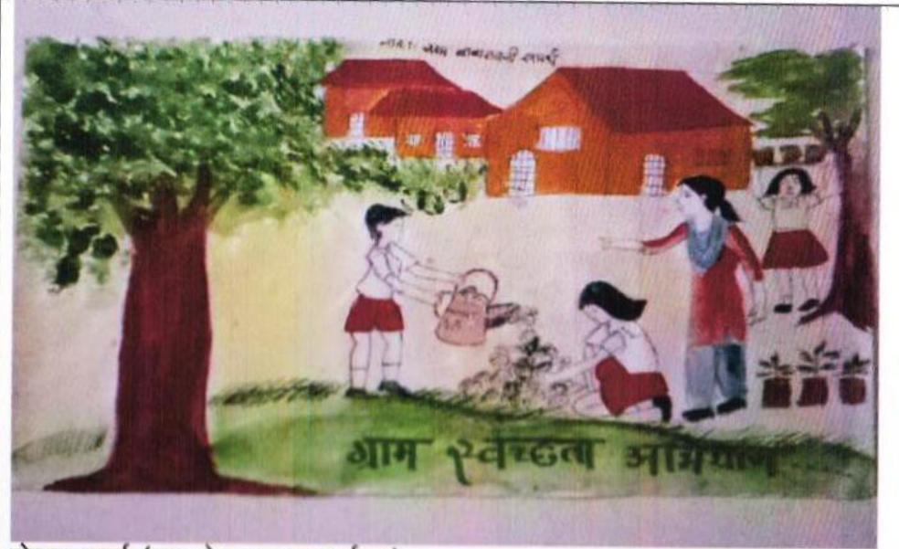
पोस्टर स्पर्धा (युवा-वैद्य सप्ताह कार्यक्रम)