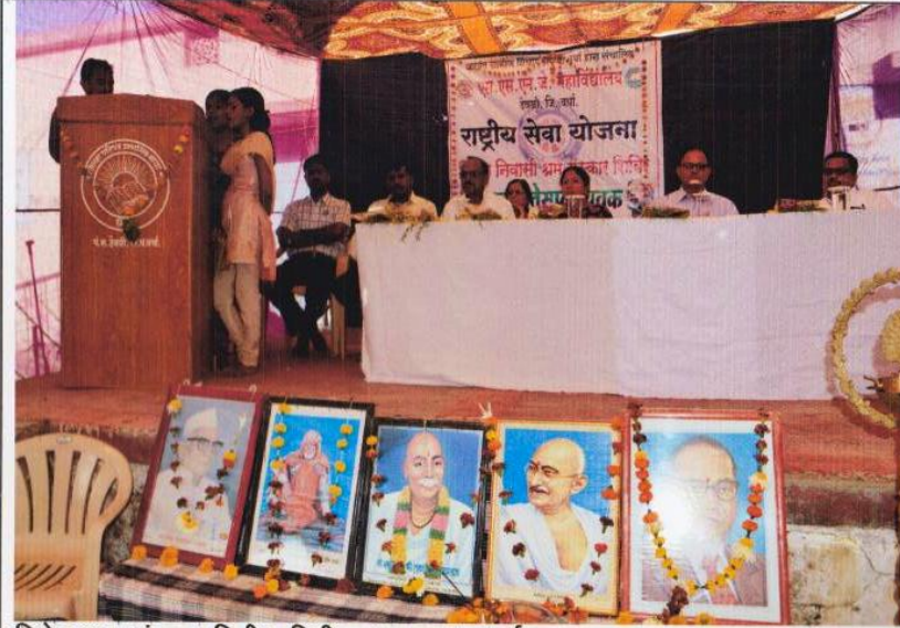
विशेष श्रम-संस्कार शिबीर, मिडी- उद्घाटन कार्यक्रम