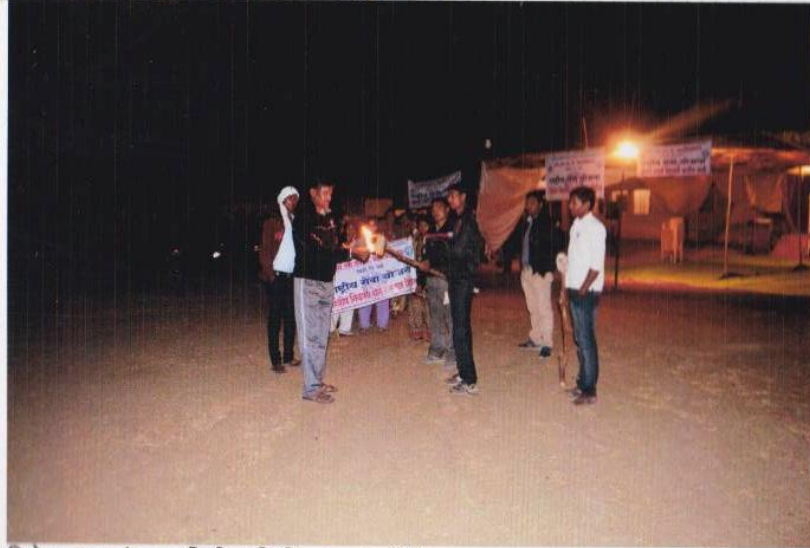
विशेष श्रम-संस्कार शिबीर, मिडी- मशाल रॅली- मशाल प्रज्वलन